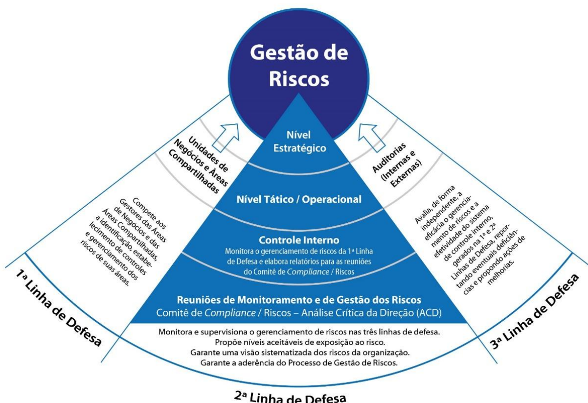
Modelo de Gerenciamento de Riscos do Sistema FIEAC (SESI-SENAI-FIEAC-IEL)

O Modelo de três linhas de defesa, utilizado pelo SESI-DR/AC, apresenta uma maneira eficaz de aprimorar as comunicações sobre riscos e controles esclarecendo funções e tarefas essenciais, dentro da estrutura mais ampla de governança da organização.