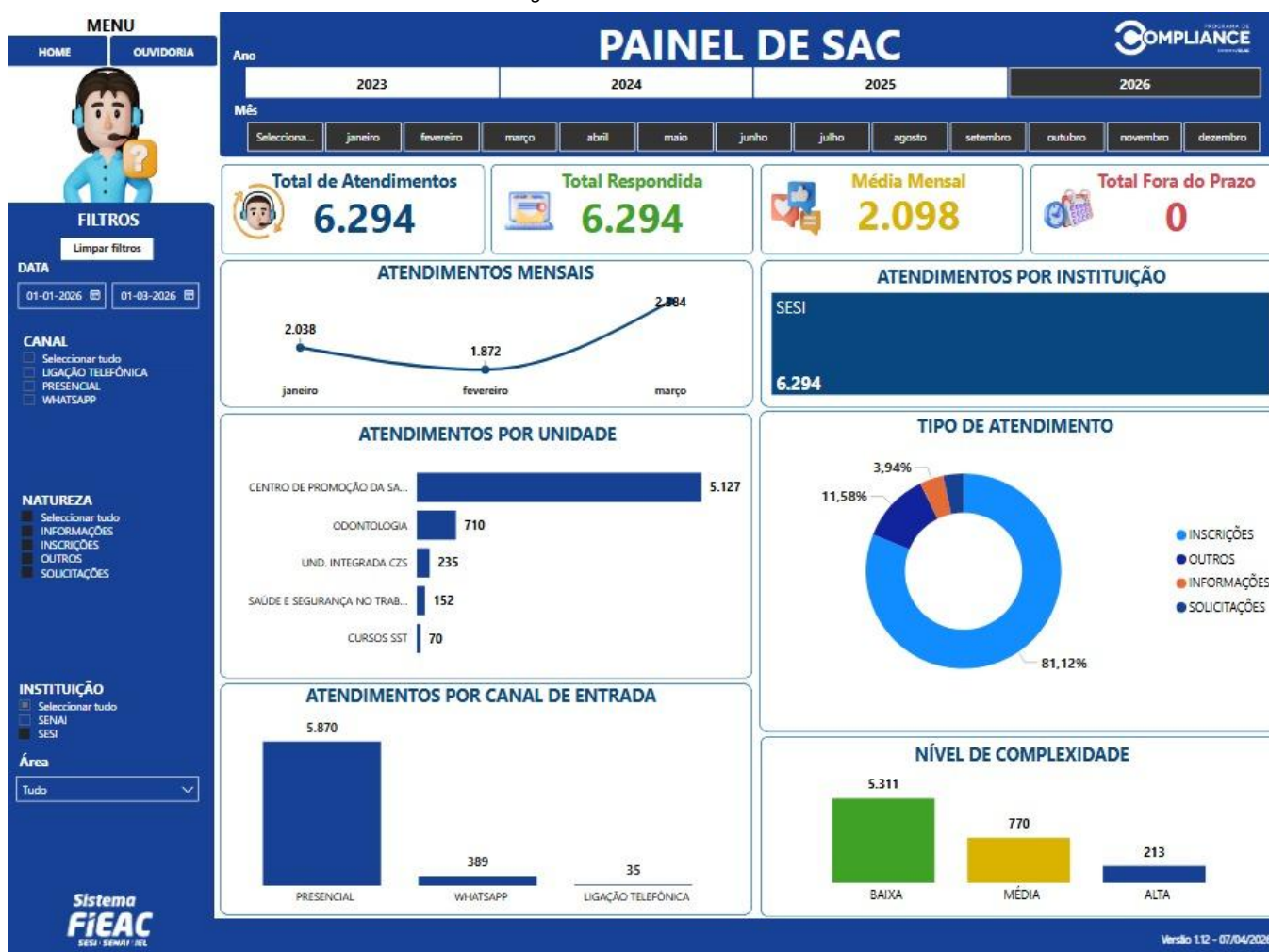
Figura do Painel Gerencial do SAC

As informações apresentadas abaixo, referem-se as demandas recebidas no primeiro trimestre de 2026, com o intuito de oferecer ampla publicidade durante todo o processo.